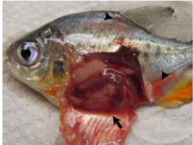
Figura 2. Animal inoculado intraperitonealmente con Aeromonas hydrophila , tratamiento 2. Nótese el líquido serosanguinolento en la cavidad abdominal (flecha) así como las hemorragias cutáneas a inmediatas a la inserción de las aletas anal y dorsal (cabezas de flecha).

A las 24 horas hubo mortalidad en todos los grupos, siendo esta mayor en los animales expuestos a Roundup®(GP) y a Roundup® más Cosmoflux® 411F (GPCF), comparada con el grupo control (T0). Al final de los 7 días la mortalidad fue del 100% (12/12) de los animales en los grupos expuestos al tóxico o a su mezcla, mientras que en el grupo control, la mortalidad fue solo del 50% (6/12) (Figura 3). Los animales sobrevivientes no evidenciaron signos clínicos de infección. No obstante, al examen de necropsia mostraron leve fluido serosanguinolento en la cavidad abdominal, así como congestión de las serosas. La bacteria pudo ser re-aislada de todos los animales experimentales.