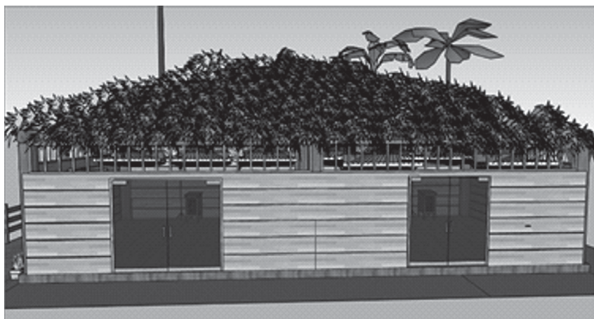
Figura 3. Diseño 3D de alojamiento indígena.

Actualmente, la única comunidad en el departamento que genera algunos ingresos por arancel de ingreso es la comunidad Ceima Cachivera, cada vez que alguien accede a su territorio para el uso de los atractivos debe realizar un pago de $15.000 pesos colombianos por persona.