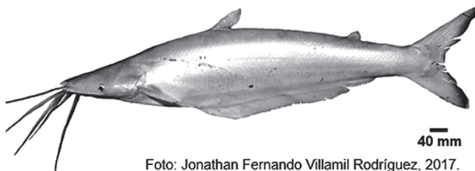
Figura 1. Hembra sexualmente madura de mapará Hypophthalmus marginatus .