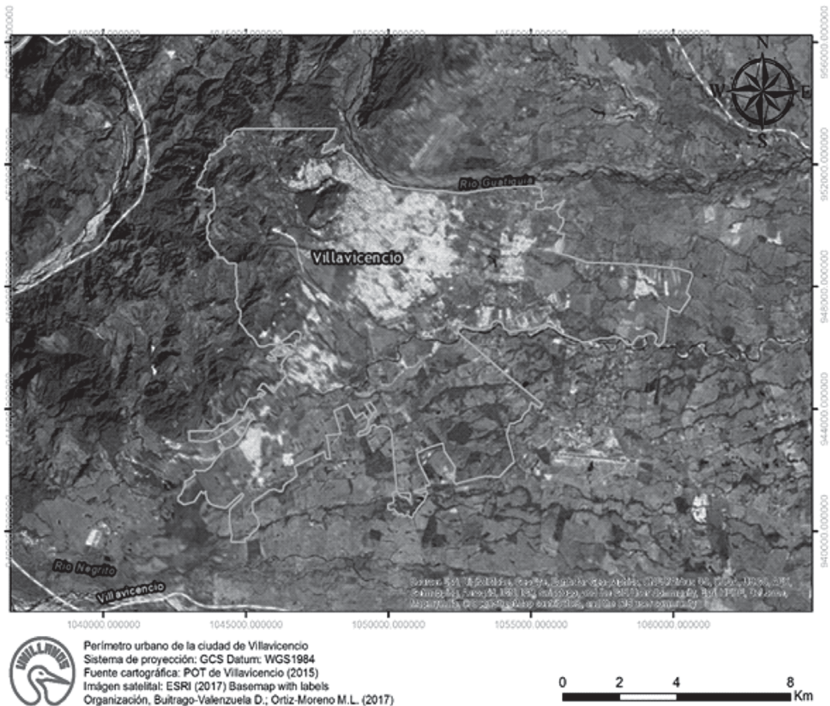
Figura 1. Área urbana consolidada de la ciudad de Villavicencio (Meta), según el POT 2015.