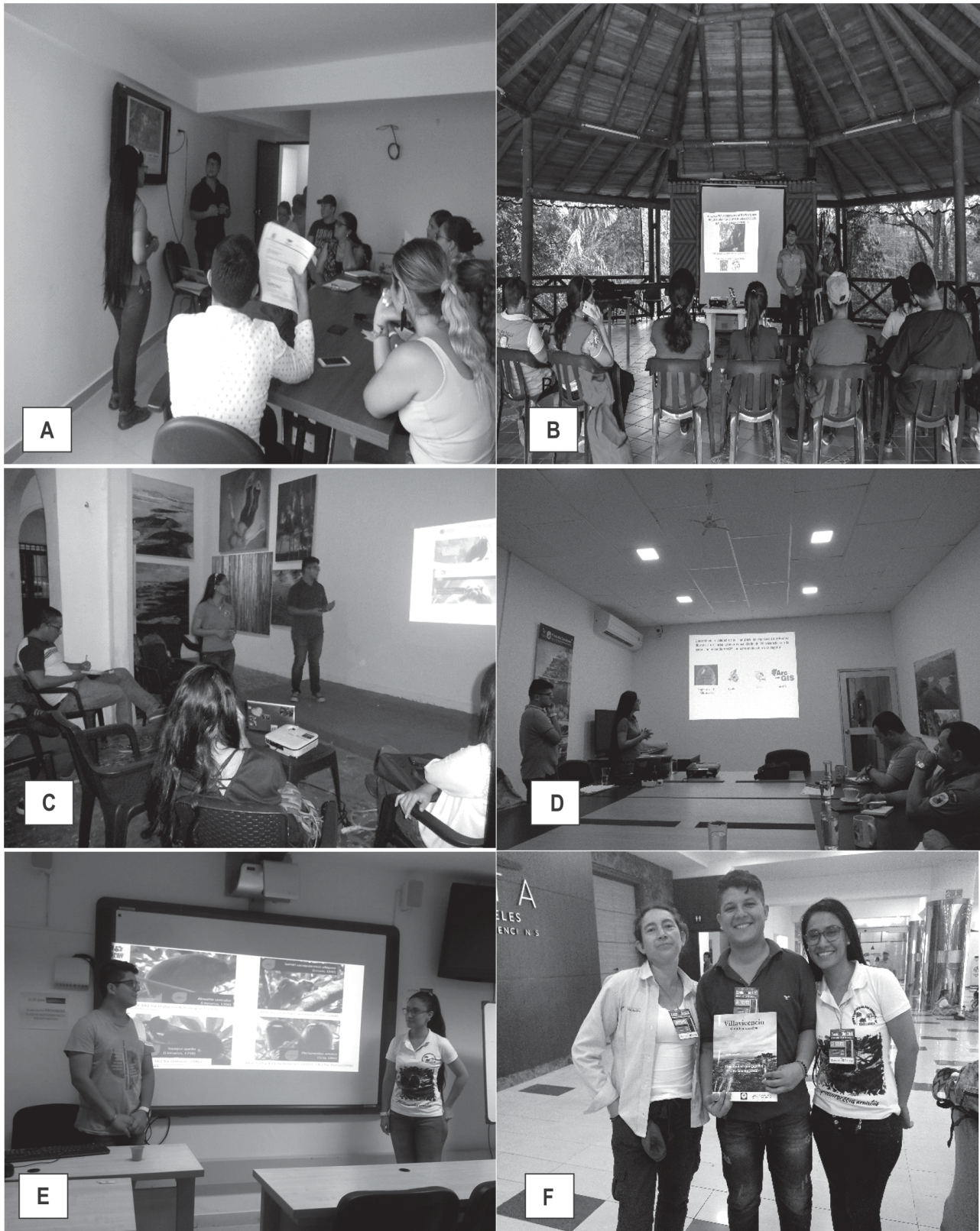
Figura 3. Socialización del trabajo de grado en los entes gubernamentales y ONG's relacionados con el área ambiental A. Secretaría de Medio Ambiente Alcaldía (SEMA) B. Bioparque los Ocarros C. Fundación William Barrios D. Parques Nacionales Naturales de Colombia E. ESAP (Escuela Superior de Administración Pública). F. Coviandina Concesionaria Vial Andina.