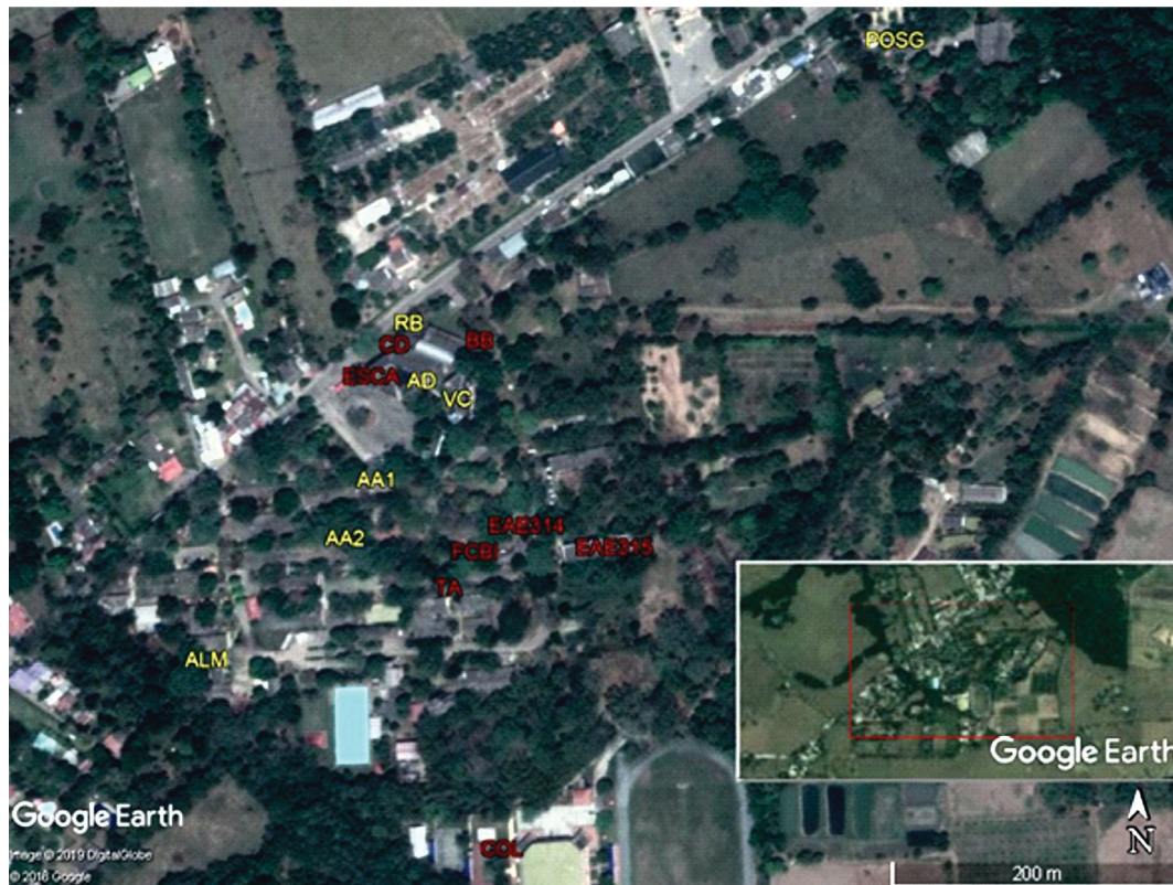
Figura 1. Edificios usados como refugios por murciélagos en el campus de la Universidad de los Llanos, Villavicencio, Colombia. Las abreviaturas corresponden a las presentadas en la Tabla 1. En color amarillo se muestran los refugios de Saccopteryx leptura , y en rojo los refugios de las demás especies encontradas. Se incluye en el inserto una imagen más alejada del campus para observar el contexto rural-exurbano. Imagen descargada de Google Earth, 24 de febrero de 2019.