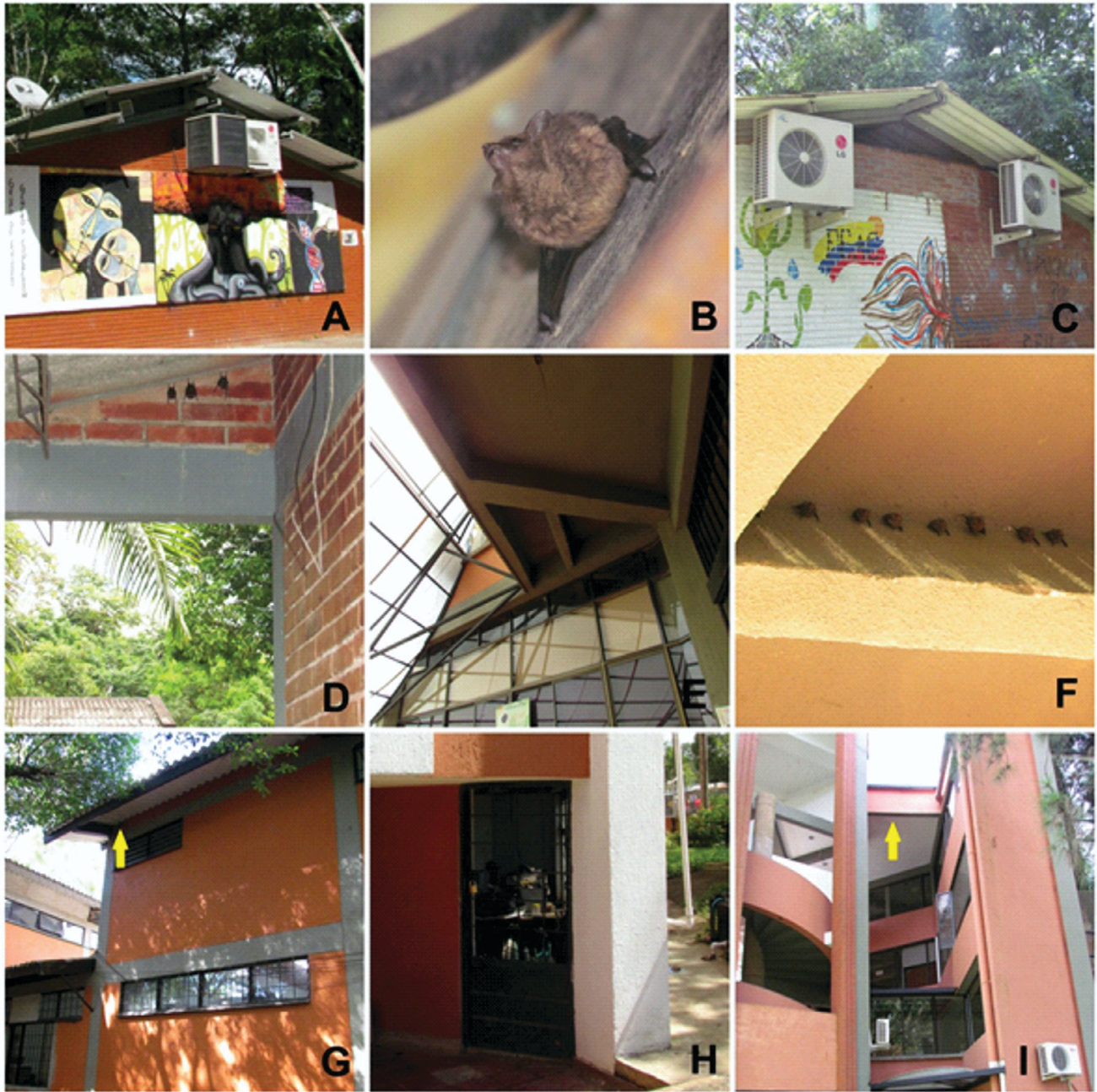
Figura 2. Edificios usados como refugios por Saccopteryx leptura en el campus Barcelona de Unillanos. A). AA1. B). Individuo perchado en aire acondicionado. C). AA2. D). POSG. E). AD. F). Individuos de encontrados en AD. G). ALM. H). RB. I). VC. Las abreviaturas corresponden a las usadas en Tabla 1. Las flechas indican el sitio de percha de los murciélagos.

tipos de refugios artificiales. Algunos Emballonuridae como S. leptura , parecen ser tolerantes a zonas urbanas, y se han reportado en el interior y exterior de edificaciones (Bradbury y Emmons, 1974; Tannenbaum, 1975). En Cali esta especie ha sido encontrada también en muros exteriores de edificios y casas de madera, y en medio de hojas secas de palma en cabañas (Alberico et al., 2005). Así, las construcciones de super-