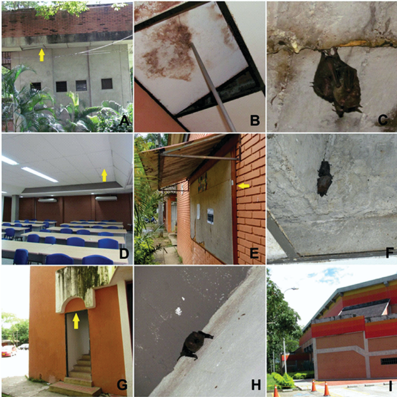
Figura 4. Edificios usados como refugios por Carollia perspicillata : A). BB; B). Rascacielo usado como refugio en BB; C). Madre y cría en CD; D). Salones AE314 y AE315. Refugios usados por M. molossus : E). TB. F). FCBI. Refugios usados por P. elongatus : G). ESCA; H). Individuo perchado en COL; I). COL. Las abreviaturas corresponden a las usadas en la Tabla 1. Las flechas indican el sitio de percha de los murciélagos.

das en algunos de los refugios más altos. Sin embargo, es necesario incrementar el esfuerzo de muestreo para determinar si realmente existe un efecto. También es necesario hacer un seguimiento más detallado de los otros refugios en diferentes épocas del año, para verificar si los más altos tienen mayor probabilidad de ser usados para tener crías.