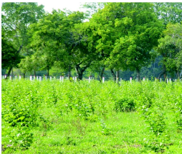
Foto 3. Densidad poblacional de Dichapetalum spruceanum . Tomada por autores

Respecto al estudio fitoquímico preliminar los resultados muestran que Dichapetalum spruceanum (tabla 2), presenta entre sus metabolitos secundarios alcaloides, compuestos cardiotónicos y cumarinas, detectados por pruebas específicas de coloración, realizadas sobre el extracto etanólico, estos resultados coinciden con algunas de las observaciones recogidas