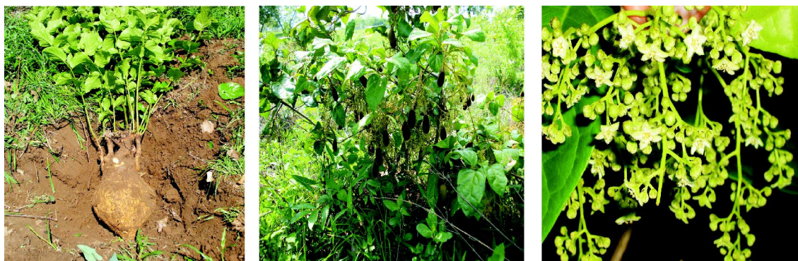
Foto 1. Dichapetalum cf. Spruceanum . A. Raíz; B. Frutos ; C. Flores

Esta especie se distribuye en los bosques de las laderas orientales del los Andes de Colombia, Ecuador y Perú, en Colombia se reporta para Antioquia, Meta, Putumayo y según datos de las colecciones registradas florece entre los meses de febrero y agosto.